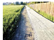
Foto: Chodník krátce před dokončením